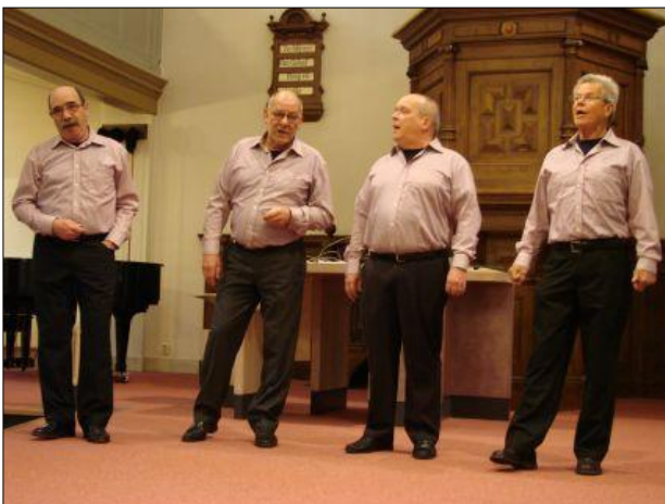
3. De avond werd opgeluisterd door een optreden van Take4ty. Een Zwols mannenkwartet dat a capella zingt.