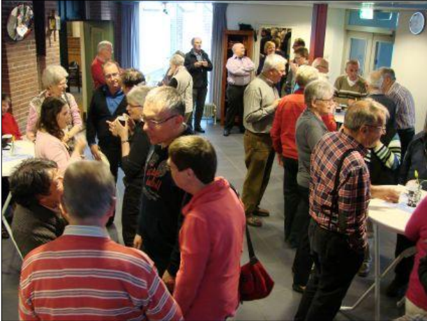
1. Ruim 80 vrijwilligers waren aanwezig en begonnen de avond met een heerlijk kop koffie met wat lekkers erbij.

Een kerk zonder vrijwilligers is eigenlijk ondenkbaar. Ook in onze Oosterkerkgemeente zijn er talloze vrijwilligers werkzaam die ieder op hun eigen manier hun steentje bijdragen om het geheel goed te laten verlopen. Zeer terecht dan ook om al deze vrijwilligers een gezellige avond aan te bieden. Deze avond vond plaats op vrijdag 20 april en De Bagijn was hierbij natuurlijk aanwezig. Door: Bert van de Venis