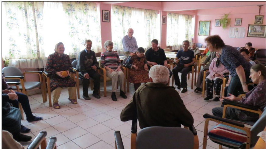
De activiteitenbegeleidster aan het werk