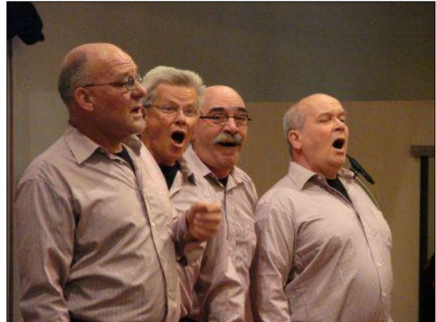
4. Met hun repertoire bestaande uit klassiek, musical, popmuziek, jazz en barbershop droegen ze bij aan een zeer geslaagde avond.