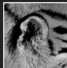
Afspraak is afspraak

UPMEYER grafimedia | communicatie WWW.UPMEYER.NL