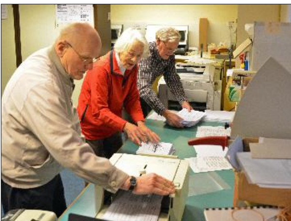
3. Elke vrijdagmorgen komt een groepje trouwe vrijwilligers naar het Kerkelijk Bureau om Kerkgroeten en Ordes van dienst te produceren.