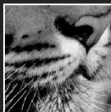
Neus voor zaken