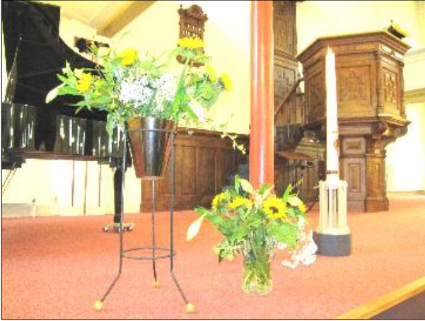
1. De Paaskaars en de bloemen die elke zondag in de kerk staan en als 'groet van ons allen' naar een gemeentelid gaan. Vrijwilligers schikken de bloemstukken.

Op de tweede zondag van de oneven maanden is in de Oosterkerk de derde collecte bestemd voor de activiteiten van de eigen wijk. Maar ook buiten die momenten zijn giften voor de wijkkas (bankrekening 115 82 71) van harte welkom. Want niet alleen De Bagijn wordt uit dat potje betaald, ook veel andere activiteiten. Een overzicht.