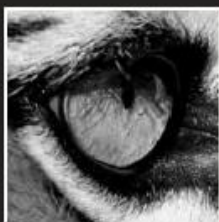
Oog voor detail

Twitter: http://twitter.com/Oosterkerk038