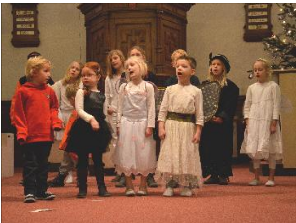
2. Op zondag is er kindernevendienst en op feestdagen organiseert de leiding altijd iets bijzonders. Met Kerst bijvoorbeeld.