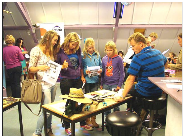
5. Jongeren kunnen kiezen uit de activiteiten van het catecheseprogramma Provider. Op de foto een infomarkt op de zolder van de Oosterkerk.